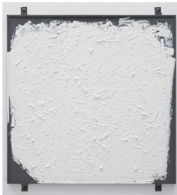
上 (図2) Stamp (2002) 油彩、キャンバス 35.6 x 35.6 cm