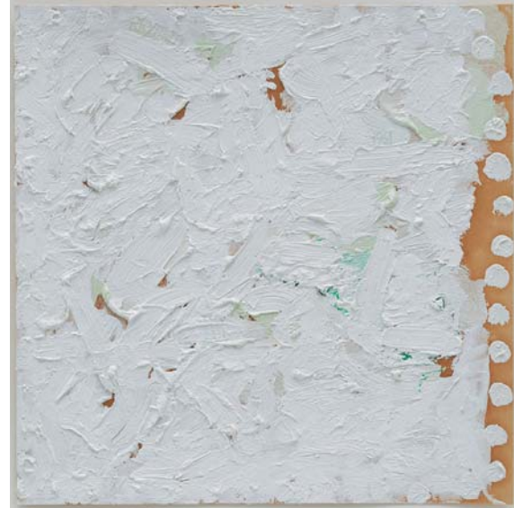
(図1) 無題 (1961). 油彩、油彩、ブリistol紙 22.7 x 22.9 cm

ファーガス・マカフリーは東京スペースのオープニングとして、現代アメリカ美術を代表する作家、ロバート・ライマンの展覧会を開催致します。本展では1961年から2003年までに作成され、ライマンの長きにわたる創作活動の全容を概観する11の絵画作品を、3月24日から5月19日まで展示致します。