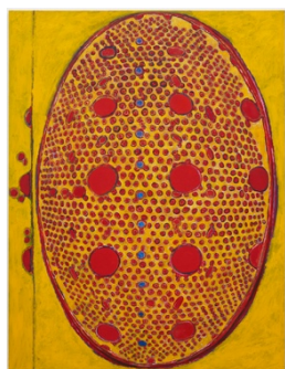
Yellow Ground, 2022

ファーガス・マカフリー東京は3月25日午後5時よりテリー・ウィンタース個展「IMAGESPACE」を開催します。作家来日のうえ、初日にはオープニング・レセプションを開催します。アーティストにとって東京弊廊で初の機会となる本展では、2022年に制作され、今回初めての発表となるリネンキャンバスの絵画3点、紙の絵画3点を展示します。