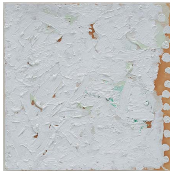
(図1) 無題 (1961). 油彩、油彩、ブリistol紙 22.7 x 22.9 cm

かに共鳴するかを追求します。中西と同様、ライマンは自身が使用するミディアムの本質的な属性を追及し、様々な形式と技術の試みを通して、「絵画」のまばゆく瞑想的な特性を探ります。このようなアプローチは実験を重ねることで成立しますが、決して偶然の出来事に依存しているわけではありません。ライマンは形態、環境、素材、表面の間にある微妙な相互関係を探るため、精密で秩序だった探求を行うのです。